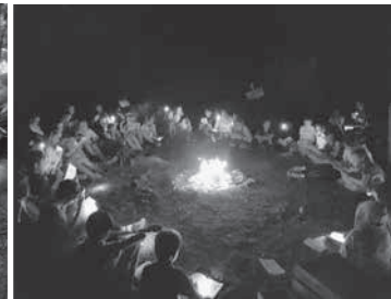
Action und Besinnlichkeit – beides hat Platz in unseren Lagern!