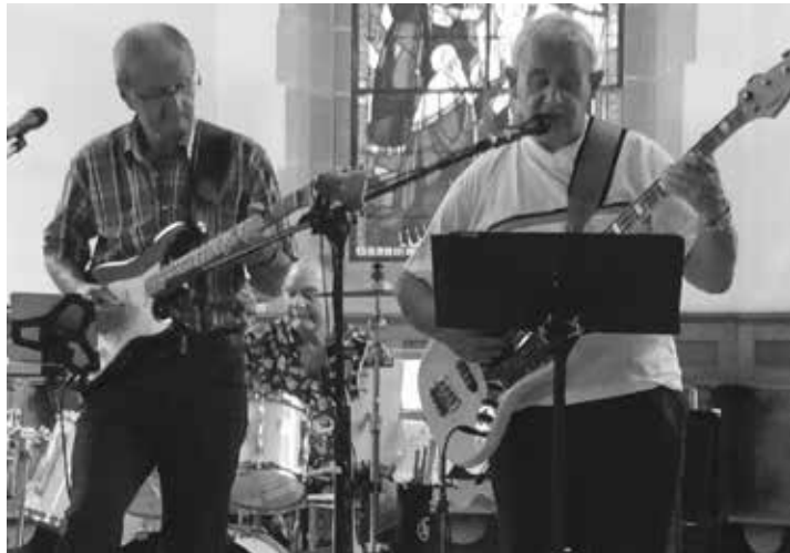
Die live Band "Sandschtei" am Musikgottesdienst vom 28. Juli in der Französischen Kirche.

Nach mehrjähriger Pause wurde wieder einmal eine Seniorenferienwoche angeboten. 15 Personen haben in Weggis am Vierwaldstättersee bei angenehmen Temperaturen die Ausflüge in der näheren Umgebung sowie auf die Königin der Berge, die Rigi, genossen. Das gesellige Beisammensein, sei es beim Singen, Spielen oder Kaffee trinken kam dabei auch nicht zu kurz. Zufriedene Gesichter mit vielen guten Erinnerungen kehrten aus dem Herzen der Schweiz zurück ins «Murtenbiet». Es ist überhaupt eine Freude, wie engagiert die Senioren und Seniorinnen mitmachen, sei es beim Seniorenfilmnachmittag, Kirchenkaffees, «Zäme Z'mittag» usw. Überhaupt sind diese vielen