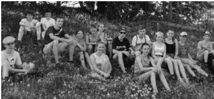
Foto aus dem Konflager im Juni 2019