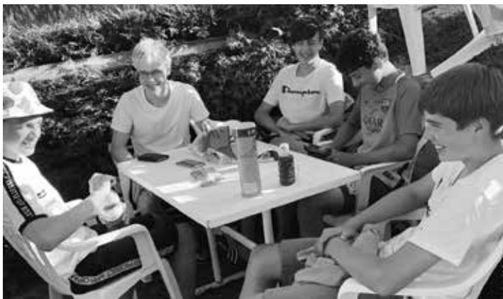
Foto aus dem Konflager