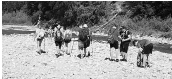
Foto aus dem Konflager