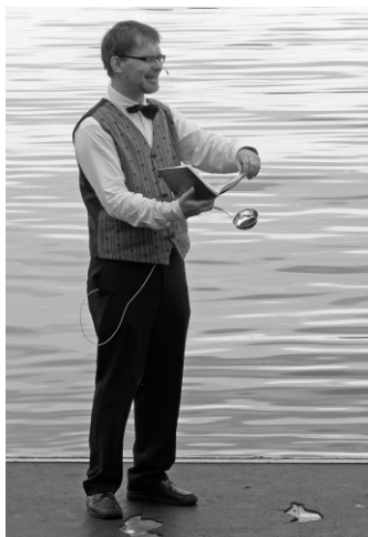
Taufgottesdienst in Muntelier

Du hast entschieden dazu beigetragen, dass ich in der Kirchgemeinde Murten heimisch wurde. Ich denke an Deine